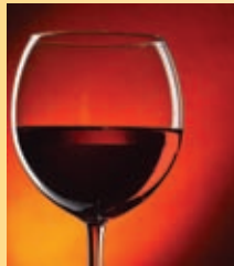
Un verre de vin