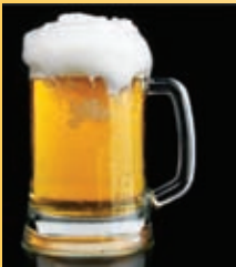
Un verre de bière