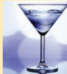
Un verre d'alcool