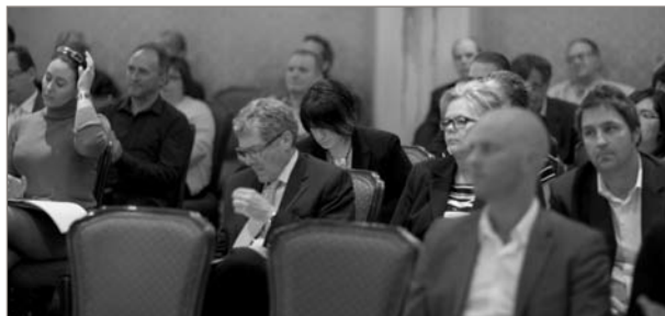
Une présence massive, des membres attentifs.