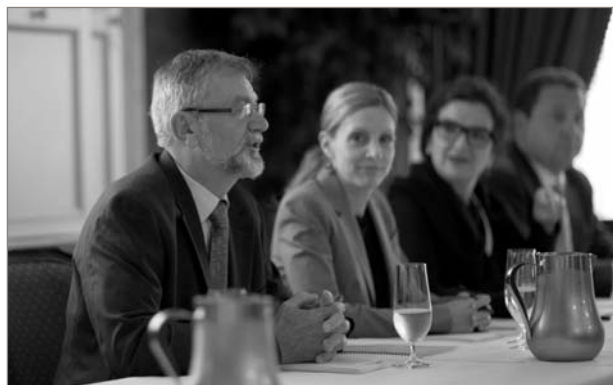
Des administrateurs d'Éduc'alcool lors de l'assemblée.